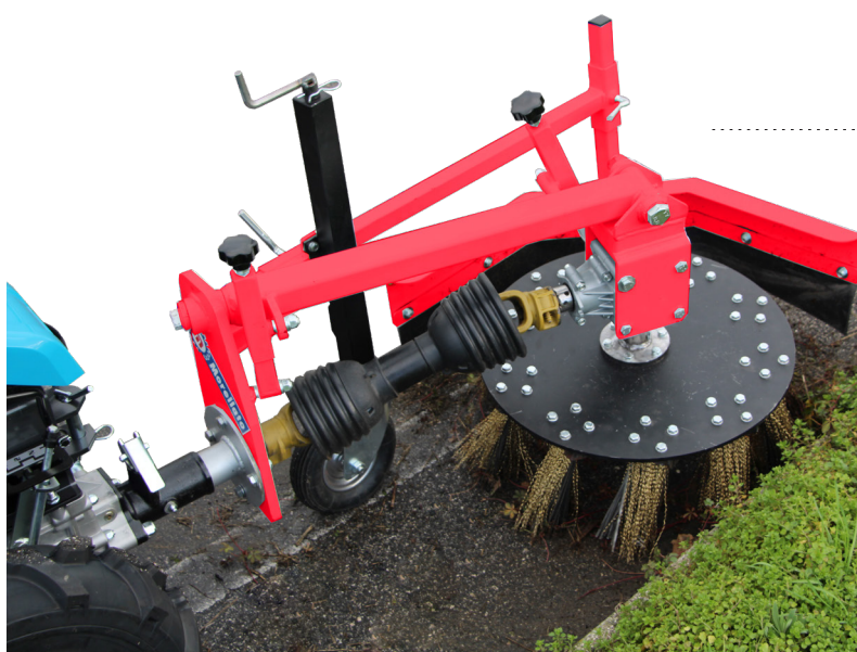
Abb. 1 Wildkrautbürste SPC 10

Verstellbarer Schutz mit abriebfestem Gummiteil, um das Herausschleudern des geschnittenen Produkts zu verhindern