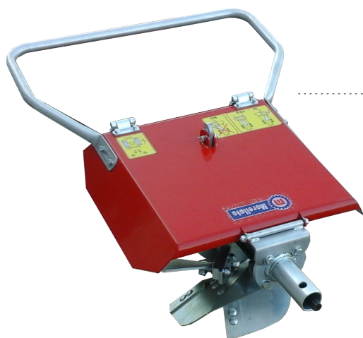
Abb. 1 Drehpflug ARM 4

Vier spiralförmige Pflugschare mit Verschleißschutzplatten Rohrschutz