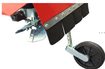
Abb. 3 Detail einstellbares Rad zur Regulierung der Pflugtiefe